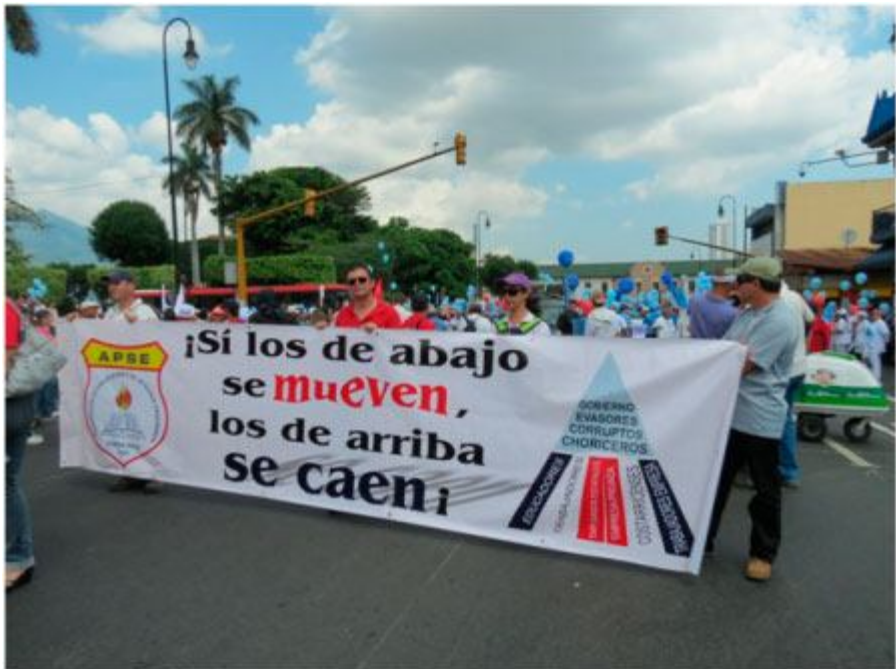
Trabajadores/as de APSE

Trabajadores de la educación, de las universidades públicas, de la seguridad social, muelleros, estudiantes, entre otros, marcharon unidos y con la firmeza de que volverán a las calles para seguir luchando contra los políticos corruptos y las políticas económicas y fiscales que están destruyendo las instituciones públicas y empobreciendo a la población costarricense.